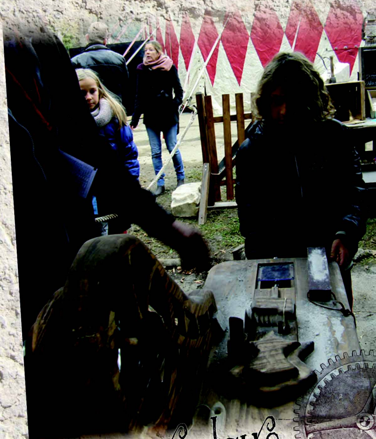
La scie circulaire pour la dernière opération de débit