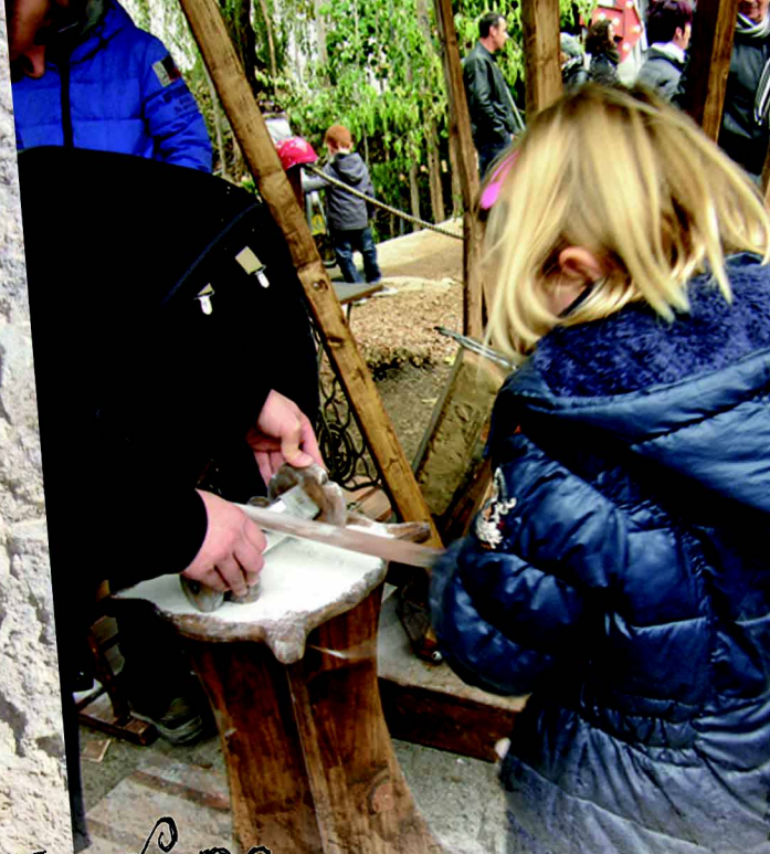
La râpe pour la préparation de la pièce principale du jeu